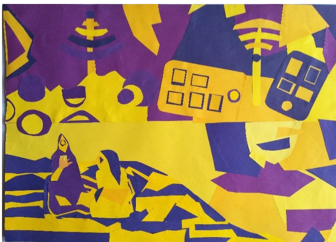
Julija Jelačić, 8.d, Podne u parku (prema slici Paula Gauguina Nave nave Moe iz 1894.)

Na školskom natjecanju iz područja vizualnih umjetnosti i dizajna "LIK 2022." sudjelovalo je 14 učenika od 5. do 8. razreda. Tema ovogodišnjeg natjecanja bila je "Ljudsko tijelo", a učenici su imali zadatak rekonponirati crno-bijelu fotografiju (fotokopiju) renomiranog umjetničkog djela s temom ljudskog tijela, uz primjenu ritma ploha u odabranom komplementarnom kontrastu. Likovne radove izradili su u likovnoj tehnici kolaža. Natjecanje je održano 11.02.2022. godine, a mentorica svim učenicima bila je učiteljica likovne kulture Petra Ružić.